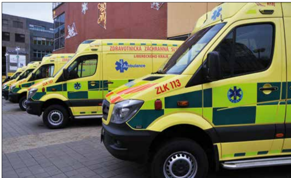
Nové sanitky pro celý kraj

Žádné „kdyby“ neplatí, když jde o život. Oprávněně čekáme, že u nás bude pomoc včas a že nám nabídne vše, co současná medicína a technika dokáže. V systému rendez-vous, který v kraji funguje, to tak je. Nedávno byl navíc posílen o nové sanitky a lékařské vozy.