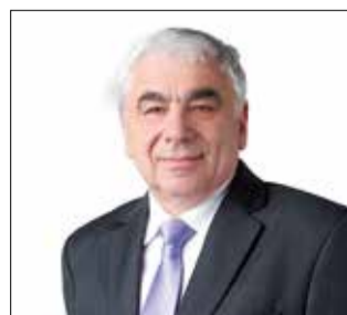
Jiří Vosecký, 64 let, senátor Parlamentu ČR, starosta Okrouhlé (1996–2014), ženatý, dvě děti